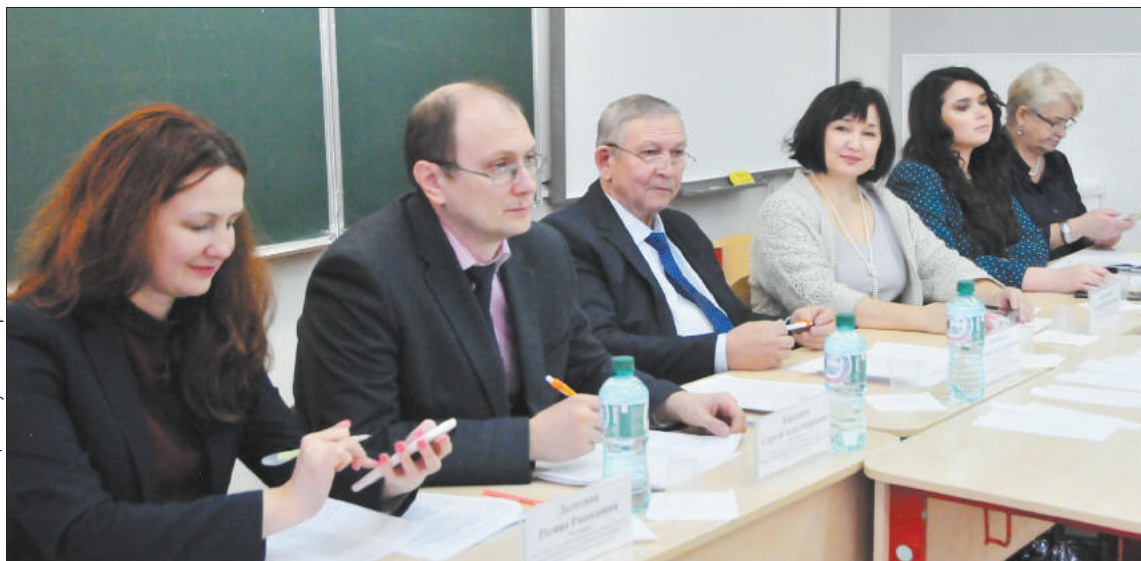
Госалкогольинспекция Республики Татарстан

В VII республиканской олимпиаде участвовали более 9,5 тысяч школьников