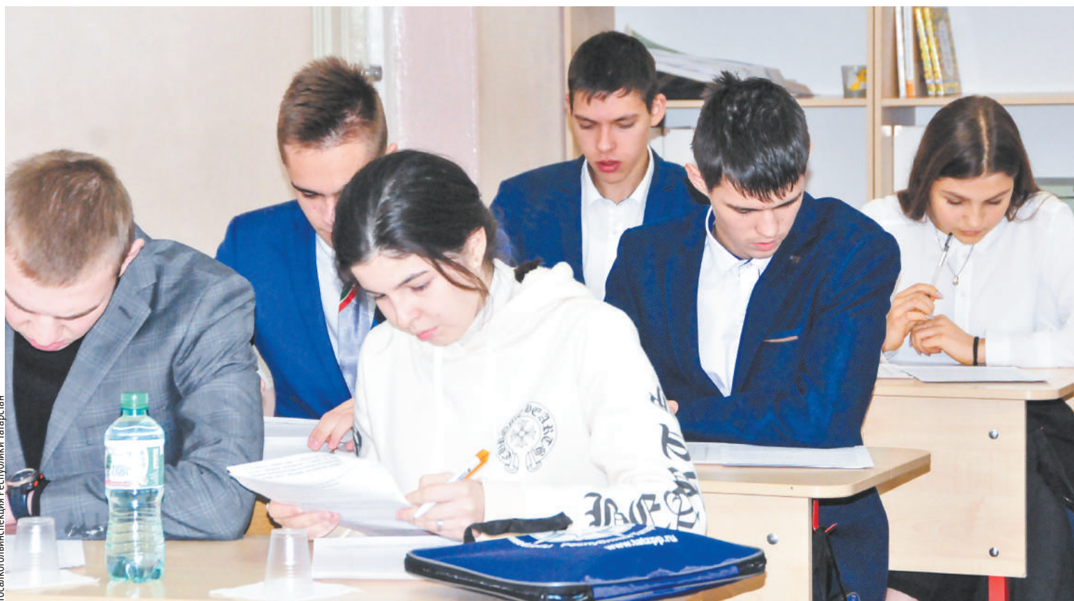
Госалкогольинспекция Республики Татарстан

В VII республиканской олимпиаде участвовали почти 9,5 тысяч школьников